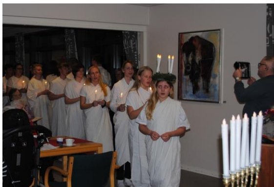
LUCIA-optog med 15 spejdere

julesalmer til klaver/saxophon – akkompagnement.