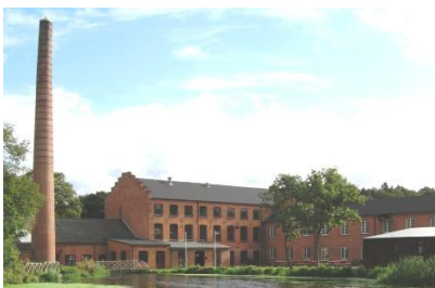
Brunshaab Gl. Papfabrik, Viborg