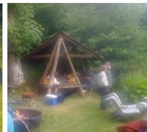
Aftenhygge ved søen