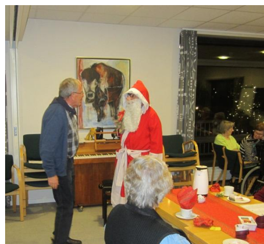
Ib byder Julemanden velkommen

orienterede om, og Luciaoptogets lys blev tændt med Fredslyset.