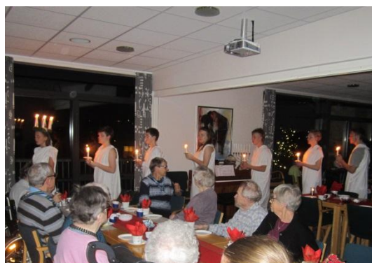
LUCIA-optog med 7 spejdere