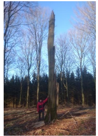
En passende tandstikker?