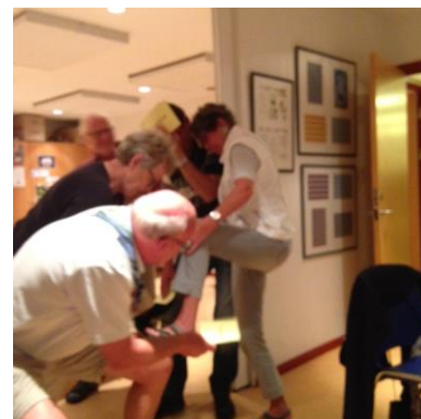
Hvilken patrulje holder bedst på kortene (med næse, skulder, knæ, fod, ansigt, hofte, albue mv.)

Ved ankomst blev vi inddelt i 6 patruljer – høns, køer, ænder, katte, hunde og får – med besked på at finde på et "råb" og nu var det tid til konkurrence. En tipskupon blev udleveret pr. patrulje og denne skulle udfyldes før hver enkelt konkurrence gik i gang. På skift blev udtaget en person fra 2 patruljer (eks. 1 kat mod 1 hund) og opgaven kunne lyde "hvem er bedst til at morse". Det blev vældig lystigt – alle gik op i legen med liv og sjæl og vi nåede 9 opgaver før klokken blev 22. En vinder fundet og guldpokal med guldkarameller uddelt. Alle patruljer "afsang" deres særkende.