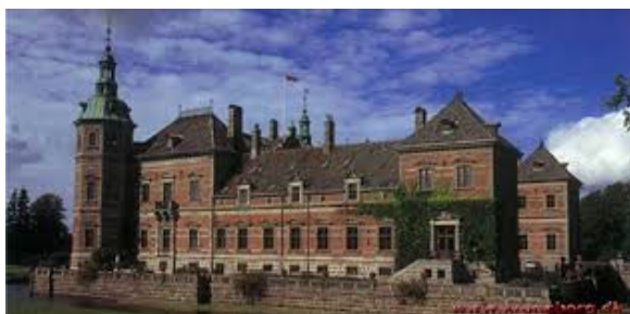
Figur 1 Frijsenborg