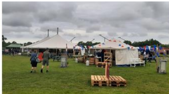
Marked i Tranebjerg