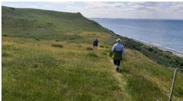
Den lidt strabadserende tur langs vestkysten mod Nordby