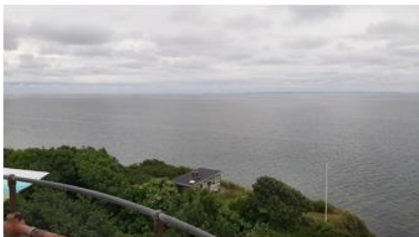
Udsigt fra Vesborg fyr mod syd