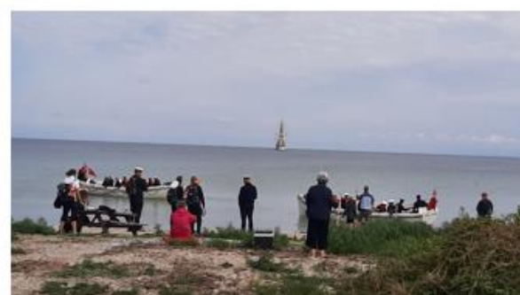
Ballen Havn havde besøg af Skoleskibet Danmark